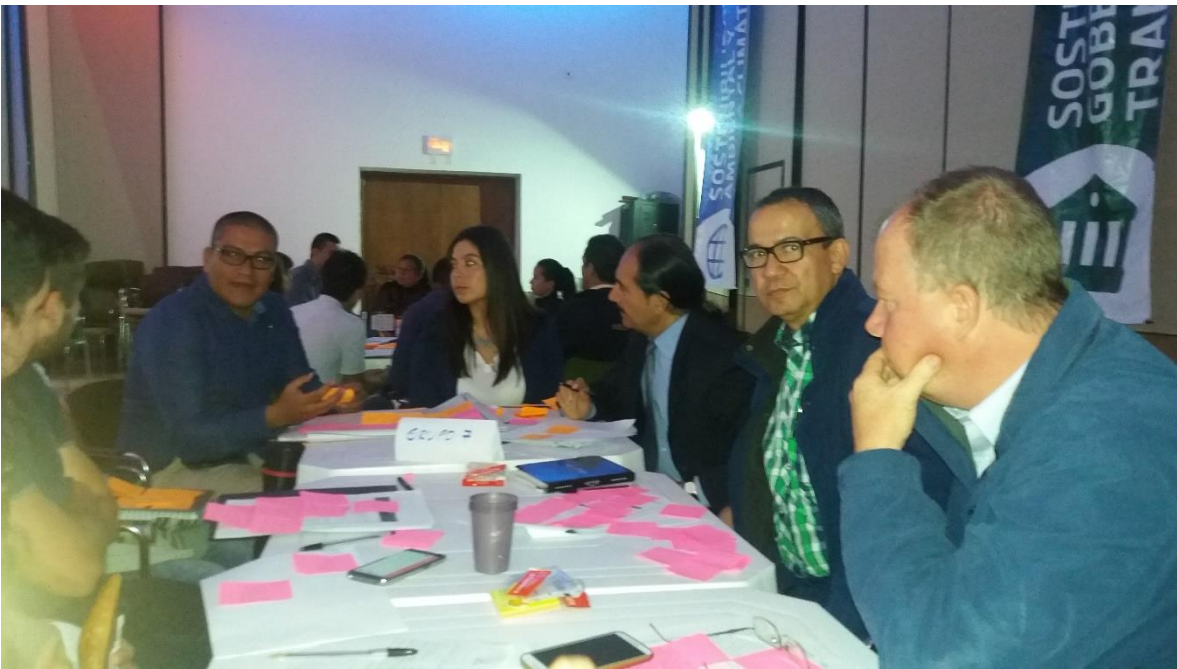
Foto. Grupos de emprendedores en Emprendetón