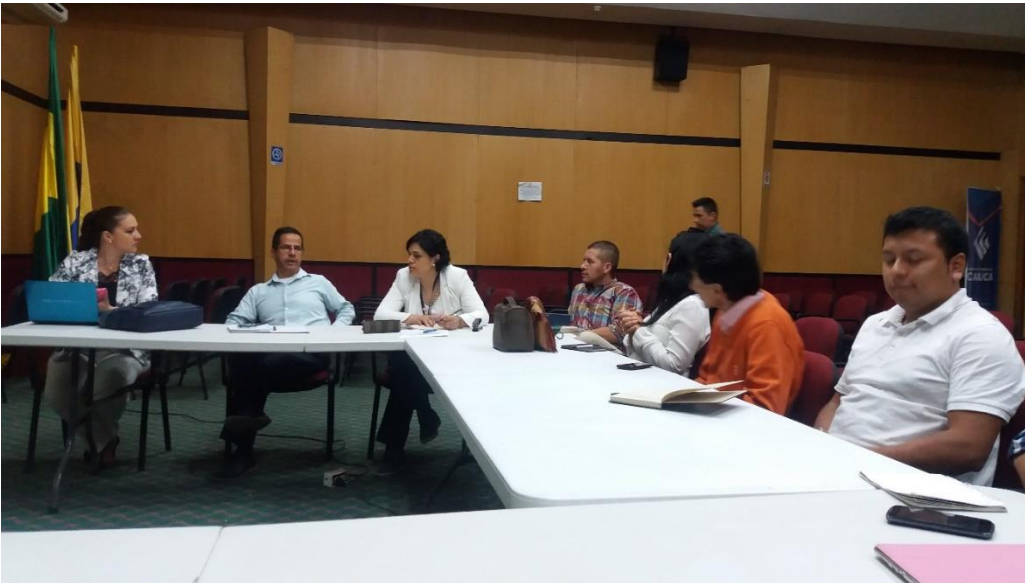
Foto. Taller emprendetón