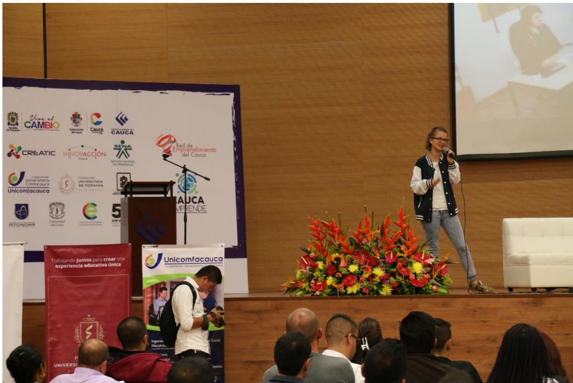
Foto. Conferencia Cauca Emprende

La Rueda de negocios del Sena contó con la participación de 30 empresas oferentes y 29 compradores.