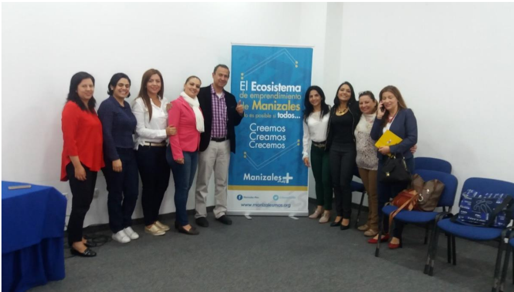
Foto visita Manizales Más