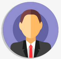
Olga Lucía Londoño Luna